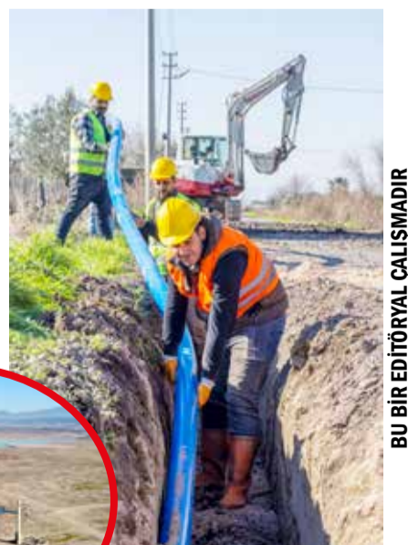
BU BİR EDITÖRYAL ÇALIŞMADIR

İZSU, aynı zamanda su kaçaklarını önlemek amacıyla eski tip sayaçları yenileyerek faturalandırmamayan su kayıplarının önüne geçiyor. SCADA sistemi kullanılarak kentteki içme suyu kaynakları ve tesisleri bir kumanda merkezinden bilgisayar aracılığıyla izlenebiliyor. Oluşturulan izole sayaç bölgeleri uzaktan izlenerek içme suyu şebekesindeki basınç kontrol ediliyor, arıza tespit ve giderme