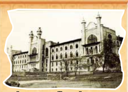
İLK TIP FAKÜLTESİ AÇILDI 1827 yılında, II. Mahmut döneminde, Mekteb-i Tıbbiye-i Şahane kuruldu.