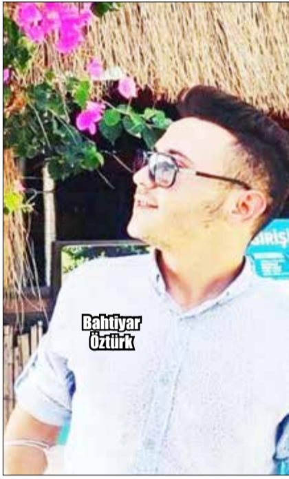
Mahallesi'nde annesine ait evin kömürlüğünde yakalandı.

Polis, otomobille olay yerinden kaçan şüphelinin yakalanması için çalışma başlattı. Ekipler, Cumhuriyet başsavcılığının koordinasyonunda düzenlenen operasyonla Ergün Göçmen'i 12 gün sonra Menteşe ilçesi Dügerek